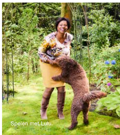
Spelen met Lulu.